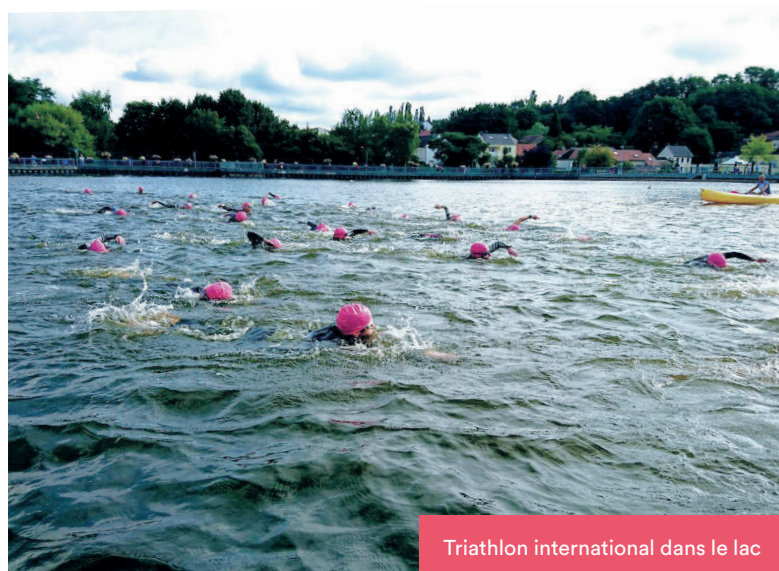
Triathlon international dans le lac