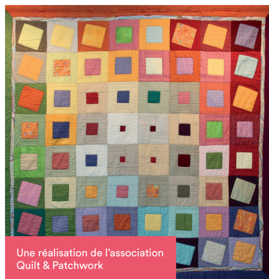
Une réalisation de l'association Quilt & Patchwork