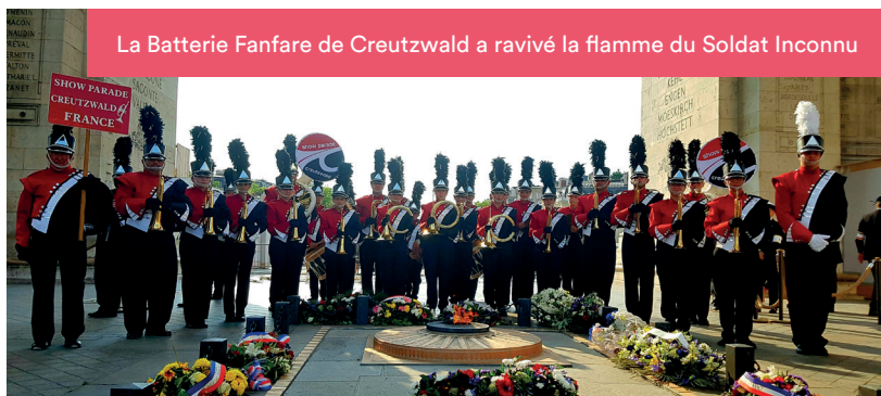
La Batterie Fanfare de Creutzwald a ravivé la flamme du Soldat Inconnu