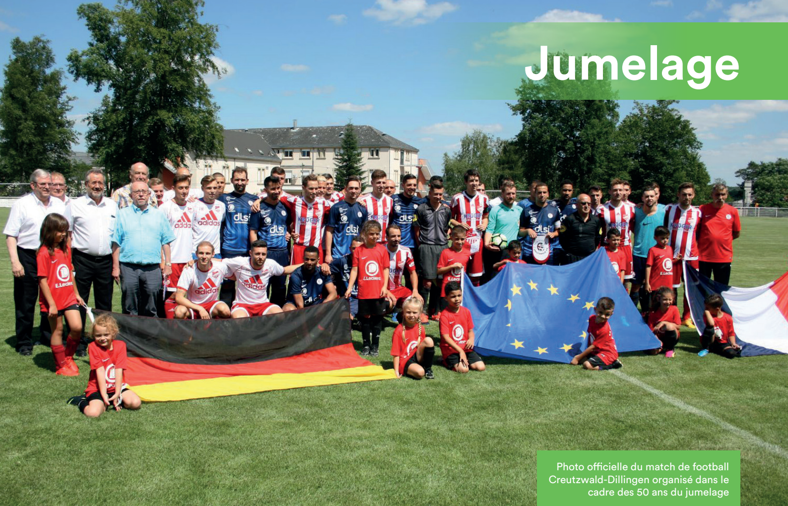
Photo officielle du match de football Creutzwald-Dillingen organisé dans le cadre des 50 ans du jumelage