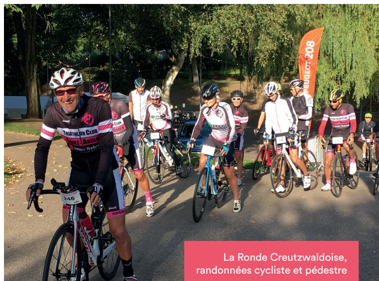
La Ronde Creutzwaldoise, randonnées cycliste et pédestre