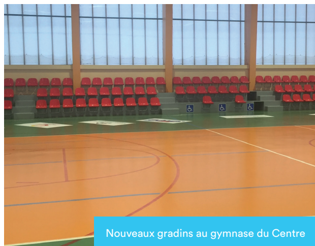
Nouveaux gradins au gymnase du Centre