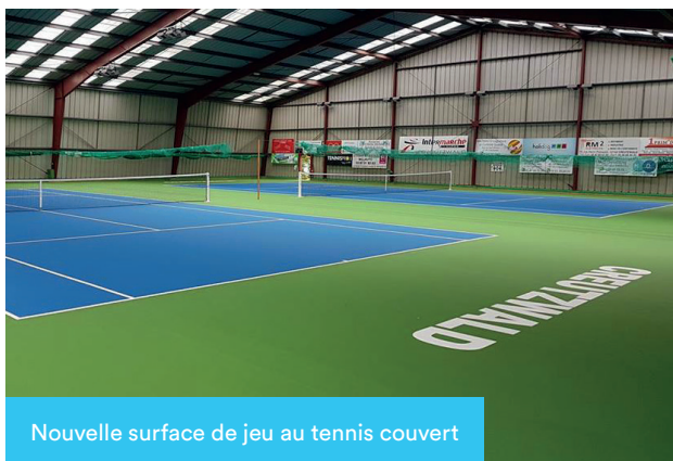
Nouvelle surface de jeu au tennis couvert

Une mue totale avec le traitement des vestiaires, des gradins, des luminaires et la création d'un espace de convivialité.