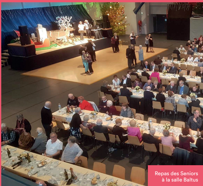
Repas des Séniors à la salle Baltus