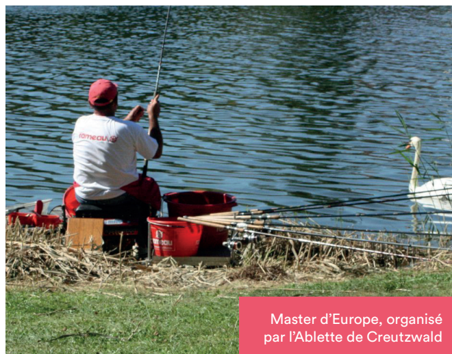
Master d'Europe, organisé par l'Ablette de Creutzwald

La qualité de l'organisation et des installations a permis au club local d'obtenir le Championnat de France, 1 ère division, pour septembre 2019. De quoi faire la fierté des membres de l'association et une nouvelle occasion de faire connaître Creutzwald hors les limites de la Grande Région Est.