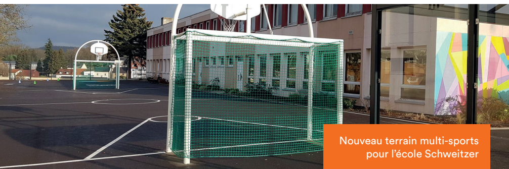
Nouveau terrain multi-sports pour l'école Schweitzer