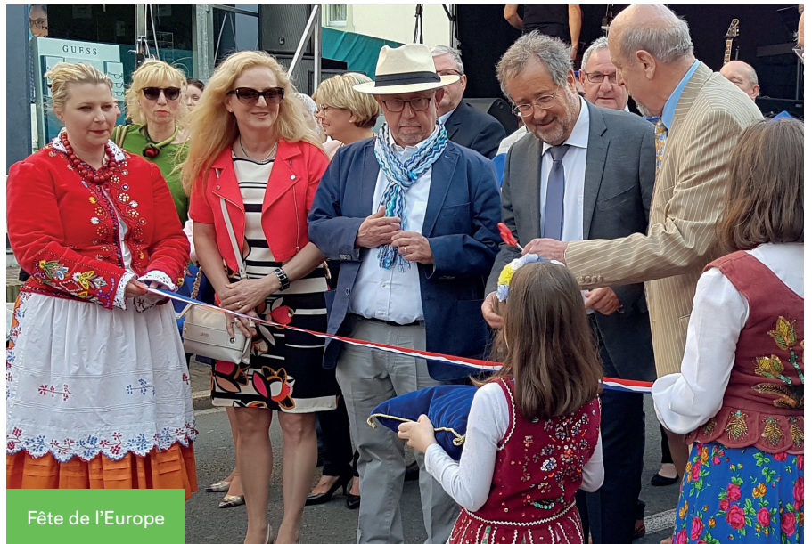
Fête de l'Europe