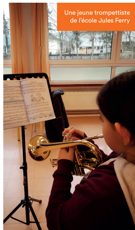
Une jeune trompettiste de l'école Jules Ferry

La commune s'investit également dans «DEMOS», un projet de démocratisation culturelle porté nationalement par la Cité de la musique. 15 enfants de Creutzwald bénéficient d'un apprentissage progressif de la lecture de la musique et de la pratique d'un instrument.