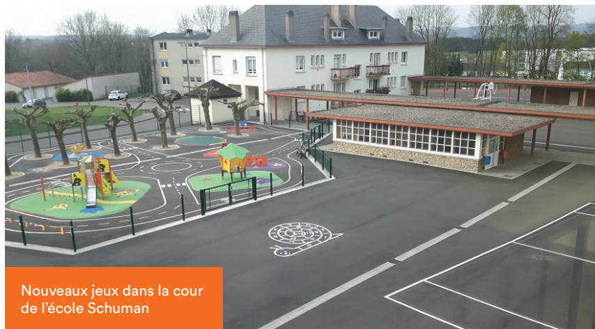
Nouveaux jeux dans la cour de l'école Schuman

De plus, toutes les classes de CM2 ont la chance de bénéficier de l'enseignement de voile et de bateaux dragons sur le plan d'eau.