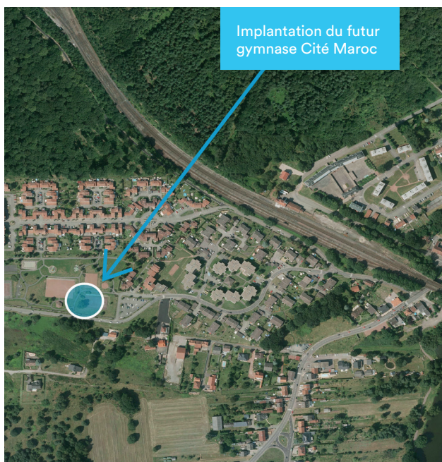
Implantation du futur gymnase Cité Maroc

A terme, il sera complété avec une nouvelle salle socio-culturelle remplaçant celle qui date des années 90. Si le lieu est arrêté, le projet reste à définir dans sa composante architecturale.