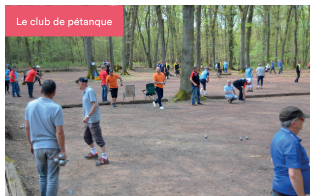
Le club de pétanque