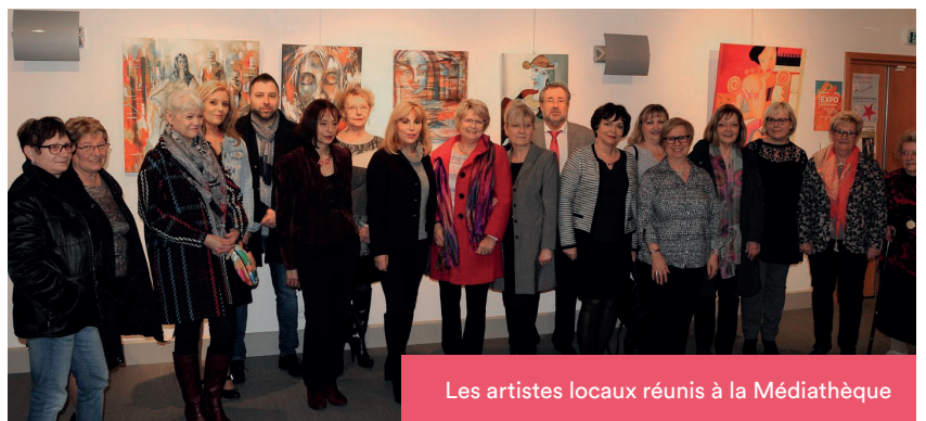
Les artistes locaux réunis à la Médiathèque