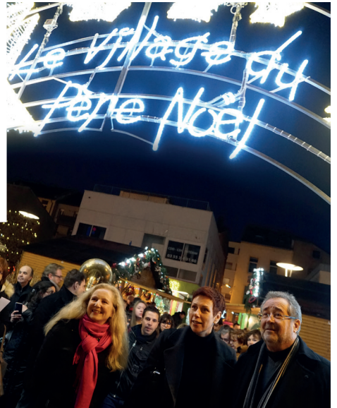
A droite : inauguration du Village du Père Noël en présence de Marie Réache, actrice de la série « Plus Belle la Vie ». En haut : la Compagnie Créole a chanté ses plus grands succès pour clôturer l'édition 2018 du Village du Père Noël.