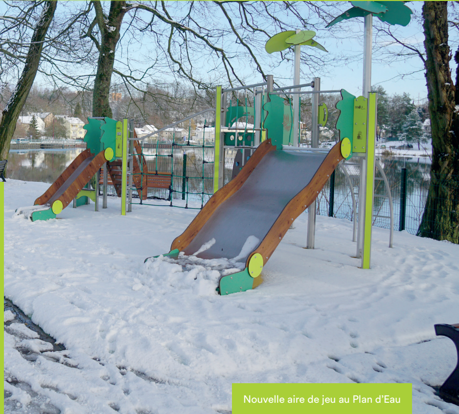
Nouvelle aire de jeu au Plan d'Eau

Dans son partenariat avec la commune, l'ASBH gère les centres sociaux, le service d'accueil périscolaire et le multi accueil.