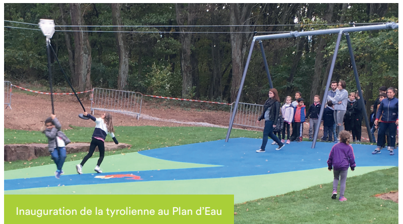
Inauguration de la tyrolienne au Plan d'Eau